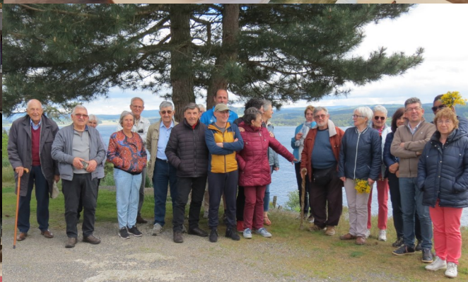
Sortie conviviale à Langogne et au musée des Calquières + Galette des Rois Arthérapie + Bulle musicale.