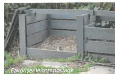
Favoriser le compostage

302 déchèteries réparties sur tout le territoire régional 98 % de la population de la région a accès à une déchèterie